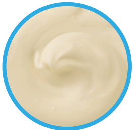
Queso crema natural