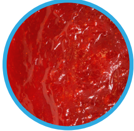
Pastelería con fresas

Los rellenos para pastelería de EFCO son una línea de productos destacada de rellenos de frutas y de crema. Perfectos para una amplia variedad de productos de pastelería y confitería, los rellenos de pastelería de EFCO están disponibles en cubos tradicionales y en mangas fáciles de usar de 2 libras