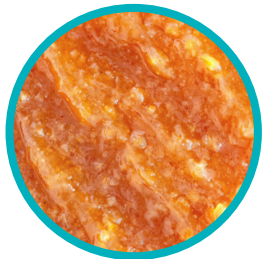
Rosquilla de manzana

Los rellenos para empanadas de manzana de EFCO están hechos con manzanas firmes y gordas, y la combinación perfecta de especias. Estos rellenos se diseñaron específicamente para resistir el horneado, la fritura, la congelación y la descongelación de las empanadas, los bollos daneses, las rosquillas, los buñuelos y las otras preparaciones en que se usan.