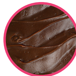
Crema Bávara de Chocolate