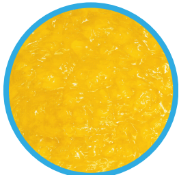
Pay de piña