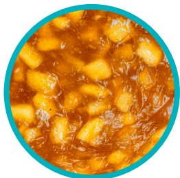
Manzana en su punto