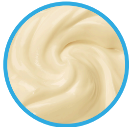
Queso crema dulce